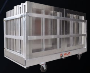
Chariot de transport

AHEROS® est la garantie pour vous que les matériels et équipements portés par notre marque répondent aux critères d'exigences sécuritaires et sanitaires de l' INRS . Nous allons encore plus loin en privilégiant 3 aspects intrinsèquement liés à votre sécurité et votre confort :