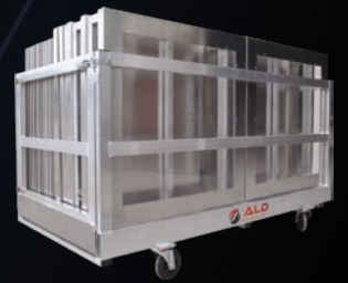
Chariot de transport

AHEROS® est la garantie pour vous que les matériels et équipements portés par notre marque répondent aux critères d'exigences sécuritaires et sanitaires de l' INRS . Nous allons encore plus loin en privilégiant 3 aspects intrinsèquement liés à votre sécurité et votre confort :